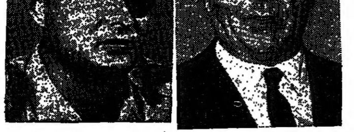
مختلفان في الوسائل ... متفقان في الأهداف !

على أنه برغم «غموض» الموقف الإسرائيلي الرسمي حول مستقبل المناطق المحتلة ، وتناقض التصريحات التي تصدر بشأنه ، فإن الصحف الإسرائيلية تكشف - في بعض الأحيان - عن أهداف إسرائيل للتوسيع من خلال تفسيرها لتصريحات المسؤولين . وقد نشرت جريدة (الجروسالم بوست) في عددها الصادر يوم الجمعة الماضي مقالاً نشرت فيه تصريحات رئيس وزراء إسرائيل الذي أتى بها يوم السبت ٢٢-٦ ، فهاهنا التمام عن (الطريقة) التي يفكر بها زعماء إسرائيل .